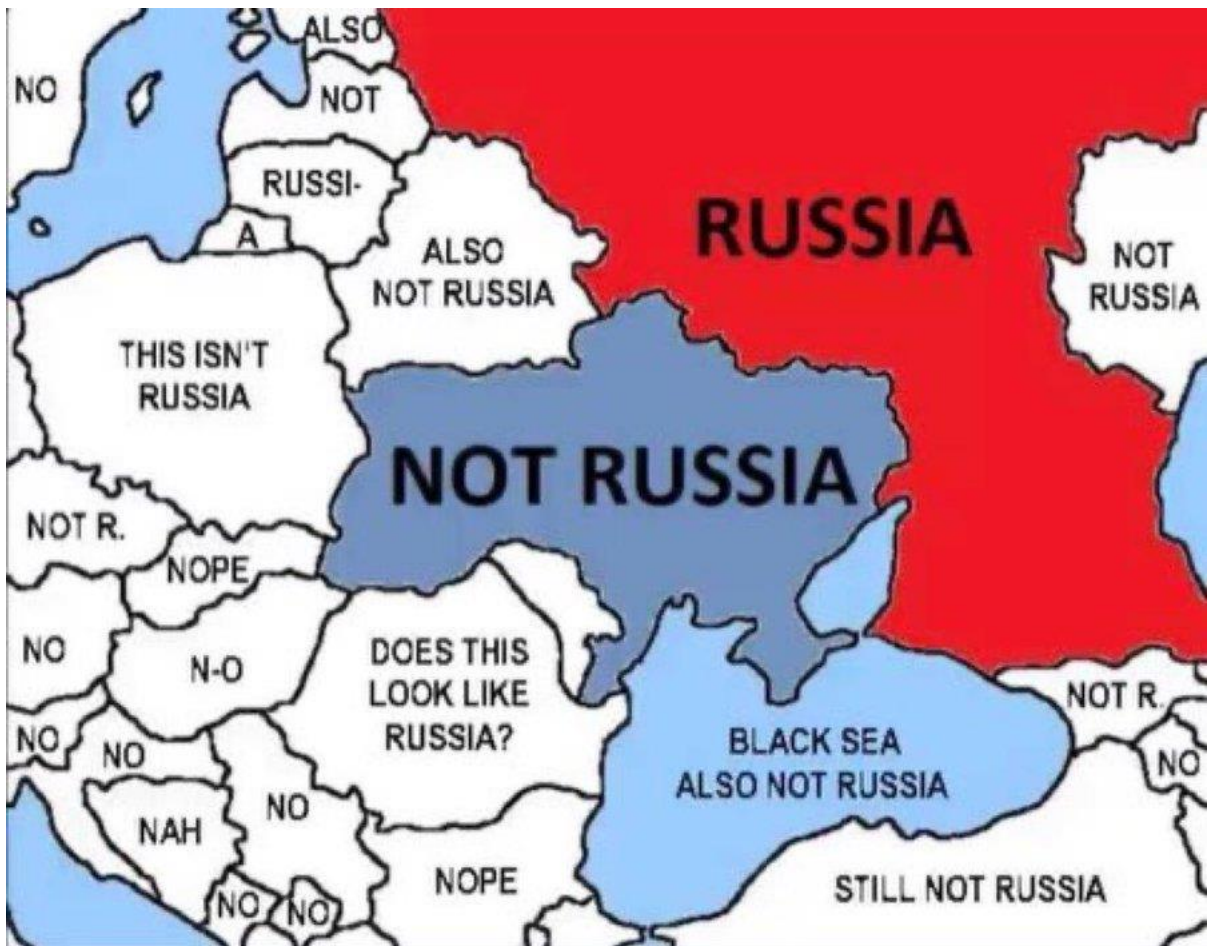
When Humor Morphs Into Horror. My Atlas of Prejudice was born in 2009... | by Yanko Tsvetkov | Atlas of Prejudice